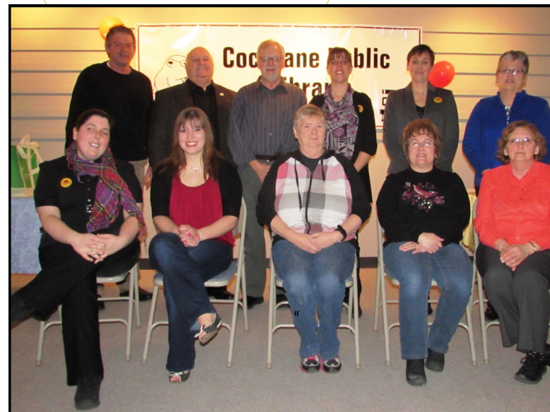
Soirée d'appréciation des bénévoles, 2014